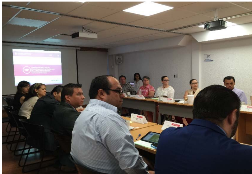
Consejo Técnico de Coordinadores de Programas Educativos de Pregrado. Reunión de Trabajo. Junio de 2016.