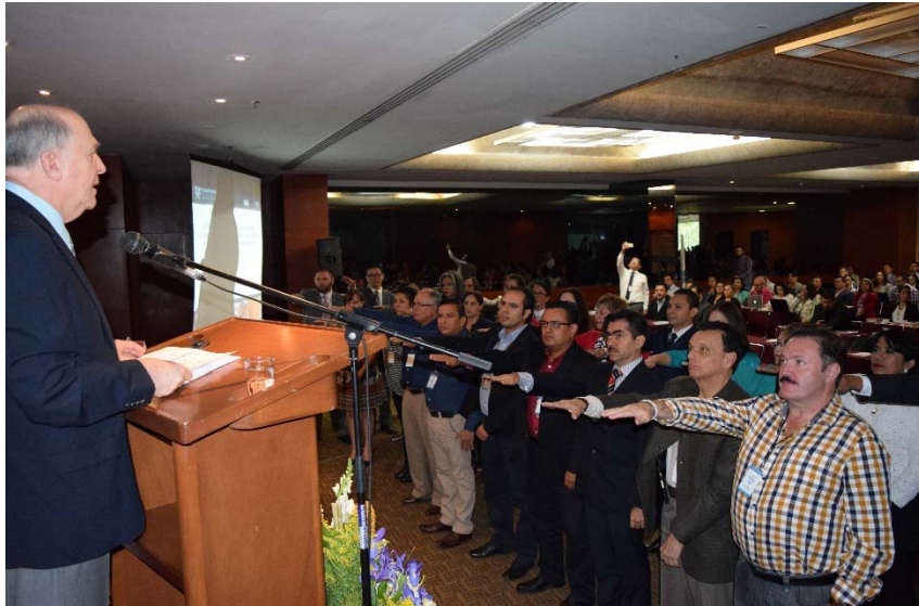
Toma de protesta del Consejo Técnico de Coordinadores de Programas Educativos de Pregrado periodo 2016-2019.