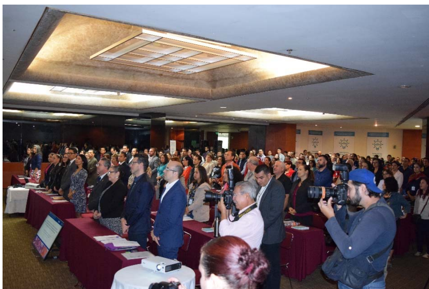
Tercera Jornada para la Gestión Académica de Coordinaciones de Programas Educativos de Pregrado de la Red Universitaria. Julio de 2016.